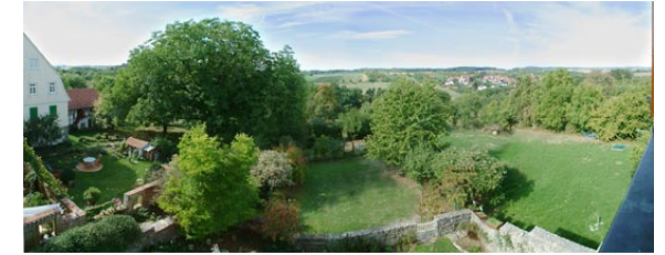
Blick auf den Gästegarten

Der Hof des Hauses kann für Spiel und Arbeiten, aber auch einfach zum Entspannen, genutzt werden. Hinter