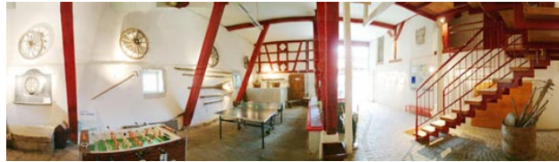
Eingangsbereich / Foyer

Im Vordergebäude sind neben dem Salon „Tinguely“ Küche und Speiseraum/Gaststube untergebracht.